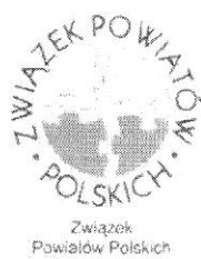
Związek Powiatów Polskich