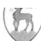
Miasto Jelenia Góra