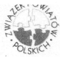
Związek Powiatów Polskich