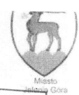
Miasto Jelenia Góra