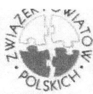
Związek Powiatów Polskich