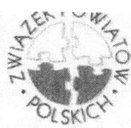
Związek Powiatów Polskich