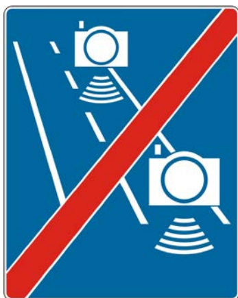
Rys. 5.2.56.3. Znak D-51b

Znak D-51b „koniec automatycznej kontroli średniej prędkości” (rys. 5.2.56.3) stosuje się w celu poinformowania kierujących pojazdami o końcu odcinka drogi, na którym średnia prędkość jazdy jest kontrolowana i rejestrowana przez urządzenia rejestrujące działające samoczynnie. Znak D-51b umieszcza się na końcu odcinka drogi objętego automatyczną kontrolą średniej prędkości, w przekroju poprzecznym drogi, w którym znajduje się urządzenie rejestrujące wyjazd z odcinka drogi objętego kontrolą średniej prędkości.