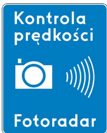
Rys. 5.2.56.1. Znak D-51

Znak D-51 umieszcza się przed stacjonarnym urządzeniem rejestrującym w odległości: