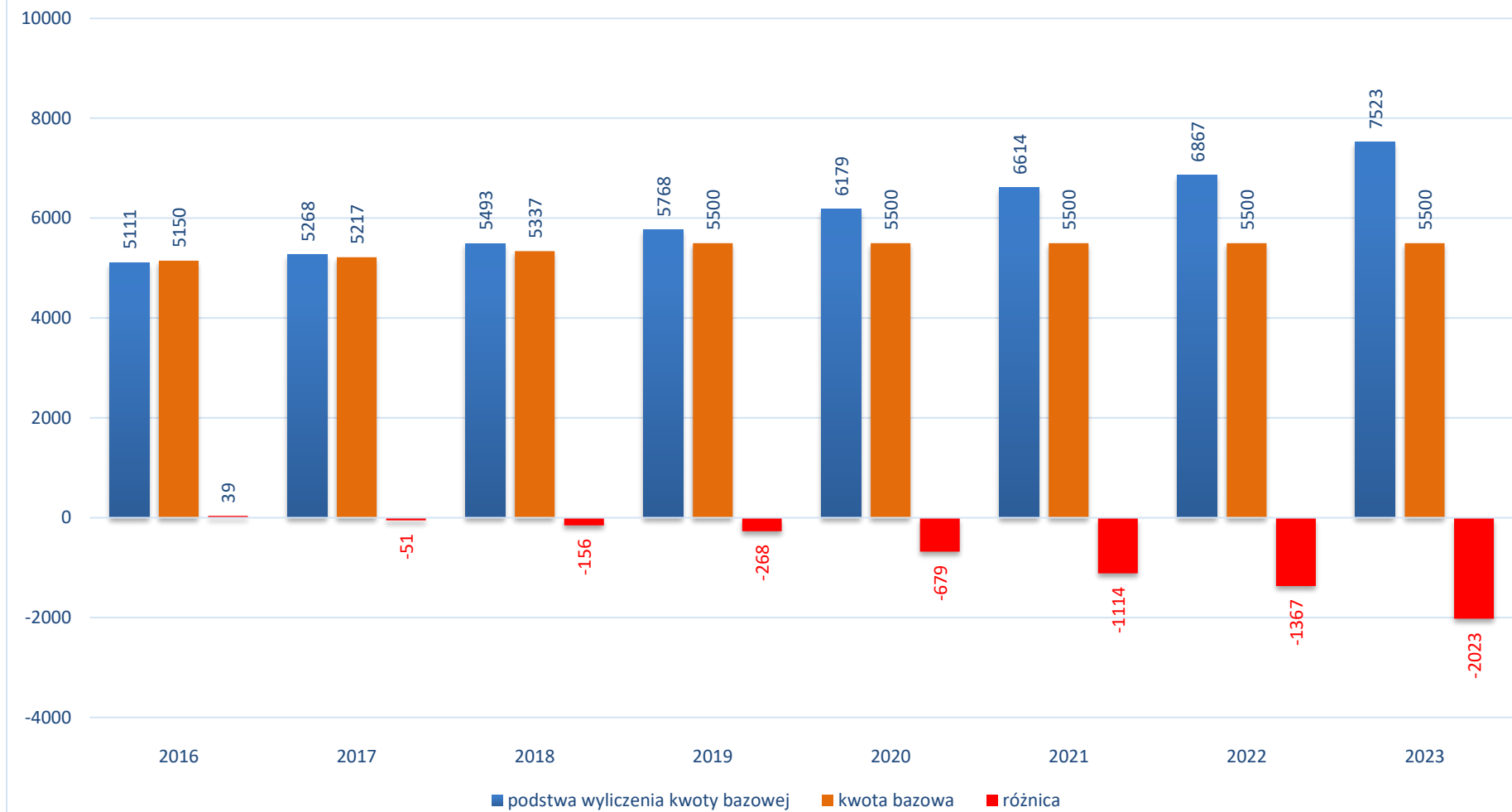
Wykres nr 4